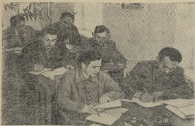
Кара-Калпакская АССР. В сети партийного просвещения города Нукуса проводят занятия 104 пропагандиста, прошедшие подготовку в вечернем университете марксизма-ленинизма и на курсах пропагандистов.

На снимке: в читальном зале Нукусского Дома политического просвещения. Пропагандисты готовятся к проведению занятий в политкружках.