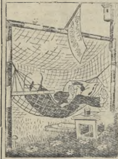
— Не атакуйте!

На заводе работает более 250 человек молодежи, имеется много спортивного инвентаря, а в работе коллектива физкультуры принимает участие лишь 25—30 человек. Все внимание совет ДСО сосредотачивает