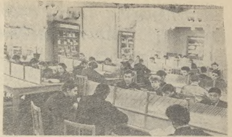
Челябинская область. Магнитогорский индустриальный техникум готовит специалистов для горных, металлургических и химических предприятий. Здесь обучается около 1500 учащихся, из них 600 человек занимаются без отрыва от производства. На снимке: в читальном зале библиотеки Магнитогорского индустриального техникума.

В прошлом году Центральная машиносчетная станция ЦСУ СССР обработала материалы пробной переписи населения, проведенной в семи районах и городах нашей страны. Одновременно была проверена вся аппаратура, подробно проработан весь инженерно-технический персонал. И когда в мае нынешнего года из всех областей, краев и республик нашей Родины начнут поступать материалы переписи, на Центральной машиносчетной станции заработают „умные“ и сложные машины, которые превратят переписные листы в четкие систематизированные таблицы.