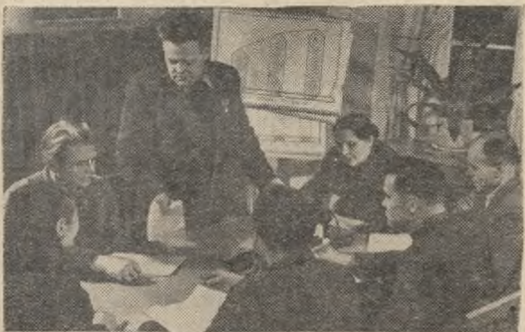
Латвийская ССР. В колхозе „Авангард“—Елгавского района составляется семилетний план дальнейшего развития артельного хозяйства. В 1965 году здесь на каждые сто гектаров сельскохозяйственных угодий будет произведено не менее 1100 центнеров молока и 120 центнеров мяса.

Обязательства приняты на районном совещании передовиков сельского хозяйства.