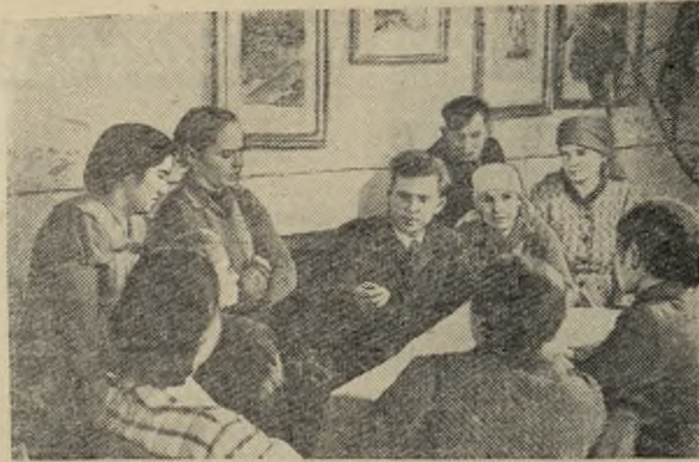
Хабаровский край. В дружном коллективе членов сельскохозяйственной артели имени Кантонской коммуны Хабаровского района трудятся русские, украинцы, китайцы. С большим воодушевлением восприняли они тезисы доклада Н. С. Хрущева на XXI съезде КПСС. В артели продолжается обсуждение контрольных цифр развития народного хозяйства СССР на 1959—1965 годы.

Не верится глазам. Давно ли школьники не умели ни пилить, ни