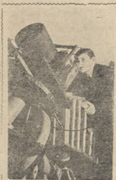
Крымская астрофизическая обсерватория Академии наук СССР, оснащенная уникальными инструментами, ведет большую научную работу.

Старшеклассники ремонтируют школьную мебель. Дает концерт кукольный театр. В плане на каникулы, кроме этого, лекция о труде—деле чести, доблести и героизма, вечер вопросов и ответов, лыжные походы и другие мероприятия.