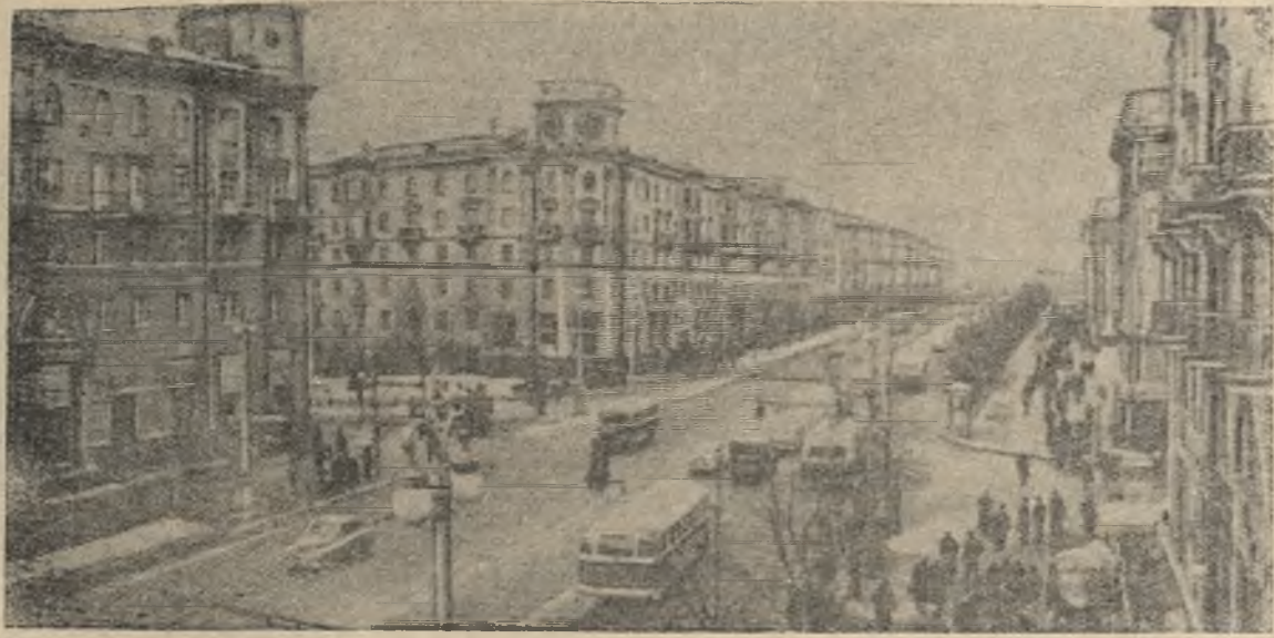
Белорусская ССР. Проспект имени Сталина в столице республики—Минске.