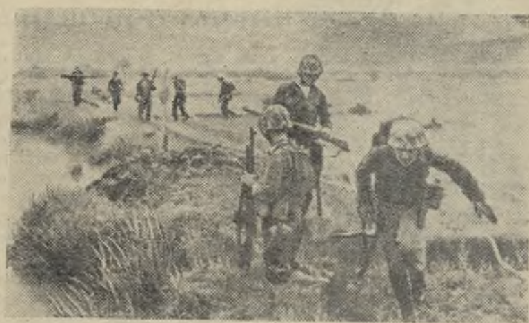
Вооруженные силы Соединенных Штатов Америки продолжают оккупировать исконную китайскую территорию — остров Тайвань и осуществлять военные провокации в территориальных водах и воздушном пространстве Китайской Народной Республики. Транспорты США доставляют на остров оружие и военное снаряжение. На снимке: американские солдаты проводят учения на острове Тайвань.