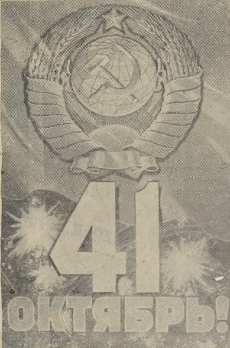
Плакаты работы художника А. Антонченко. (Государственное издательство изобразительного искусства).