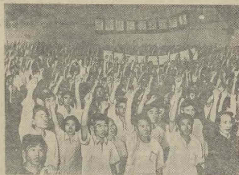
Китайская Народная Республика. Рабочие и инженерно-технический персонал Шинцзиньшаньского металлургического завода близ Пекина провели митинг и демонстрацию в поддержку заявления премьера Государственного совета КНР Чжоу Энь-лая об обстановке в районе Тайваньского пролива.

ТАСС уполномочен также заявить, что вынужденный действиями Соединенных Штатов и Великобритании возобновить испытания ядерного оружия, Советский Союз будет и впредь продолжать свою последовательную борьбу за немедленное и повсеместное прекращение испытаний атомного и водородного оружия на вечные времена. Достижение этой цели явилось бы крупным вкладом в дело сохранения мира и обеспечения всеобщей безопасности.