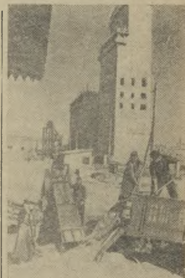
Павлодарская область. Хлебо-робы Лозовского района обязались сдать государству 16,5 миллиона пудов зерна.

Редакции газет «Уральский рабочий», «Вечерний Свердловск» обязаны улучшить работу с письмами, предавать гласности факты бюрократизма и волокиты при рассмотрении заявлений и жалоб трудящихся.