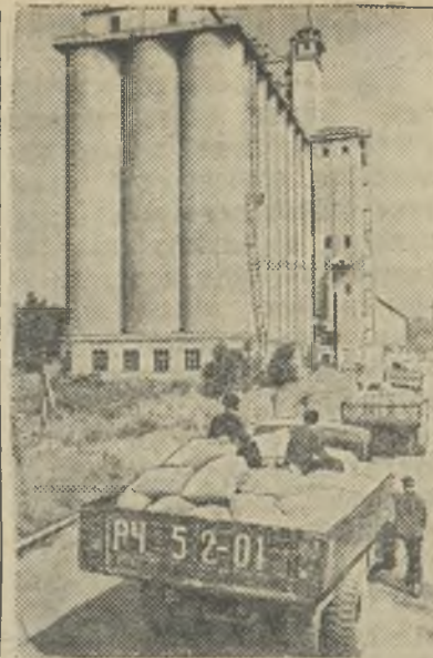
Татарская АССР. На Казанский элеватор непрерывно поступает из колхозов и совхозов республики зерно нового урожая.

Надо заготовку кормов вести такими темпами, чтобы обеспечить кормами общественное животноводство на весь стойловый период.