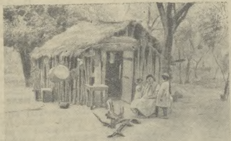
Аргентина. Хижина индейцев в районе Тартагал (провинция Сальто).

Умение вести себя в обществе производит очень хорошее впечатление, располагает к человеку и может послужить началом возникновения большой, хорошей дружбы встретившихся в обществе людей.