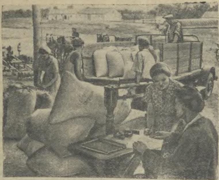
Краснодарский край. Хлеборобы Кубани досрочно выполнили план хлебозаготовок и дополнительно продали государству сверх плана более 22 миллионов пудов зерна.

Сейчас колхозы приступили к выдаче зерна на трудодни в счет аванса.