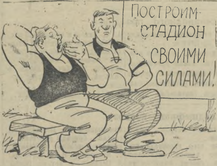
Силенок у нас не хватит!

Много разговоров ведется среди молодежи села Черемиски о строительстве своего стадиона. «Нужен стадион», — решают ребята. И дальше этого решения дело не идет. Некоторые даже пытаются обвинить в этом работников Дома культуры, якобы они ничего не предпринимают, чтобы строительство стадиона началось. А сами? Сами палец о палец не ударят, чтобы расчистить хотя бы небольшую площадку для игры в футбол, волейбол, сделать беговые дорожки.