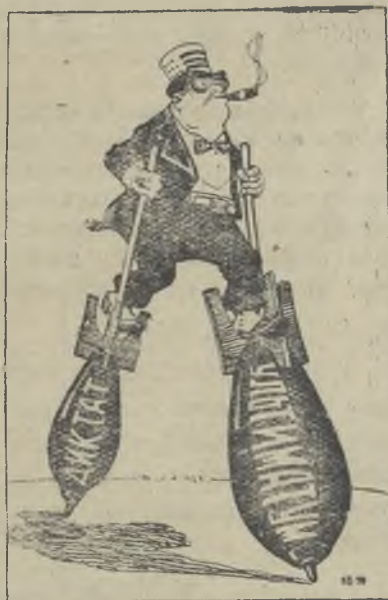
С «позиции силы» или американские ходули. Рис. А. Брусилевского.

сованные в сохранении мира, принимают меры, направленные на то, чтобы предотвратить войну и защитить священные права народов, борющихся за свою свободу и независимость. Мировые государства и народы в этот тревожный и ответственный момент не могут стоять в стороне, ожидая развития событий на Ближнем и Среднем Востоке. История показывает, что, когда агрессоры встречают решительный отпор и всеобщее осуждение, их злобным замыслам не суждено осуществиться. Если американские и английские империалисты откажутся вывести свои войска из Ливана и Иордании и будут пытаться расширить агрессию, у народов всего мира хватит сил для того, чтобы разбить врагов наголову».