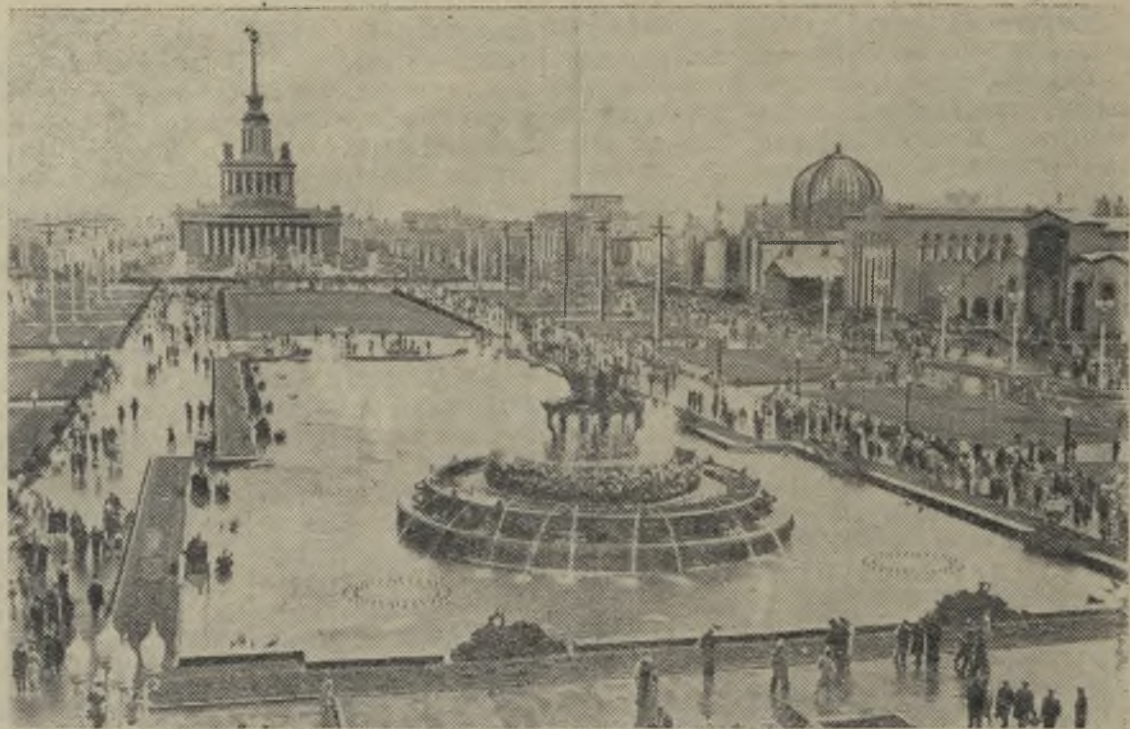
Москва. Всесоюзная сельскохозяйственная выставка 1958 года.