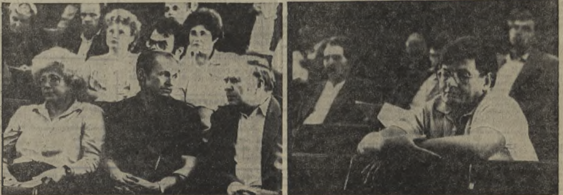
На снимке: в зале заседания пленума горкома партии.

Каково на этот счет ваше мнение и предложения?