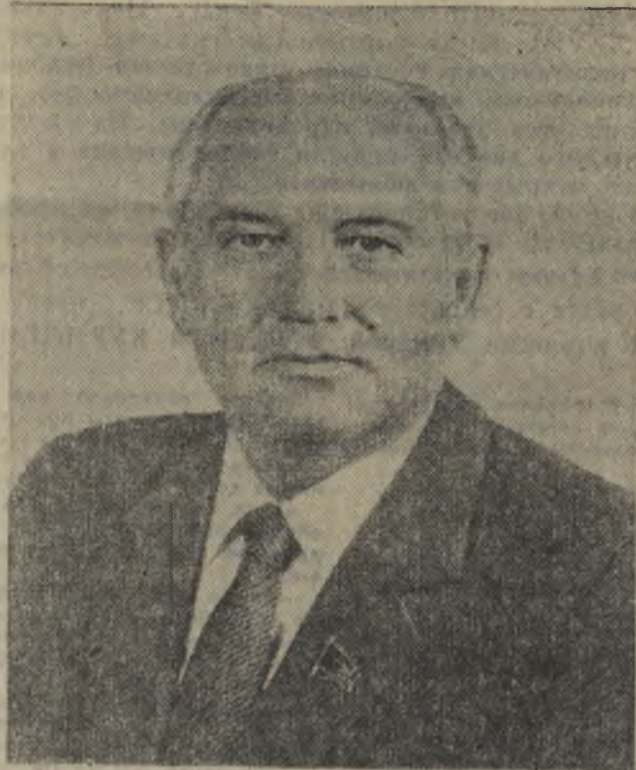
Генеральный секретарь Центрального Комитета Коммунистической партии Советского Союза МИХАИЛ СЕРГЕЕВИЧ ГОРБАЧЕВ