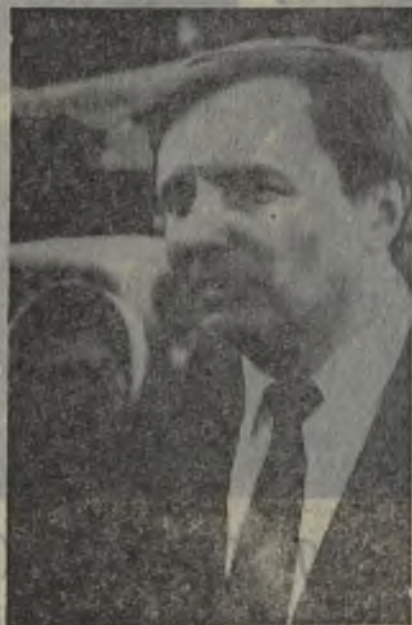
Вода—свет, радио—поросята, дороги—молоко, свалки—столбы, тапоны—зубы, телефон—почта, хлеб—порядок... Все это только в поселке Быстринском.

Наша цель—не восстановление истории поселка. Нам интереснее день сегодняшний и завтрашний. Однако верно говорят, что без прошлого нет и будущего. И мы не можем спокойно относиться к судьбе людей, кто десятки лет трудился в жизни отдал развитию города, строил мифическое светлое будущее и в 80-е годы подошел к черте разочарования. И наступило время дать правдивую оценку нашему прошлому и настоящему, подумав о будущем.