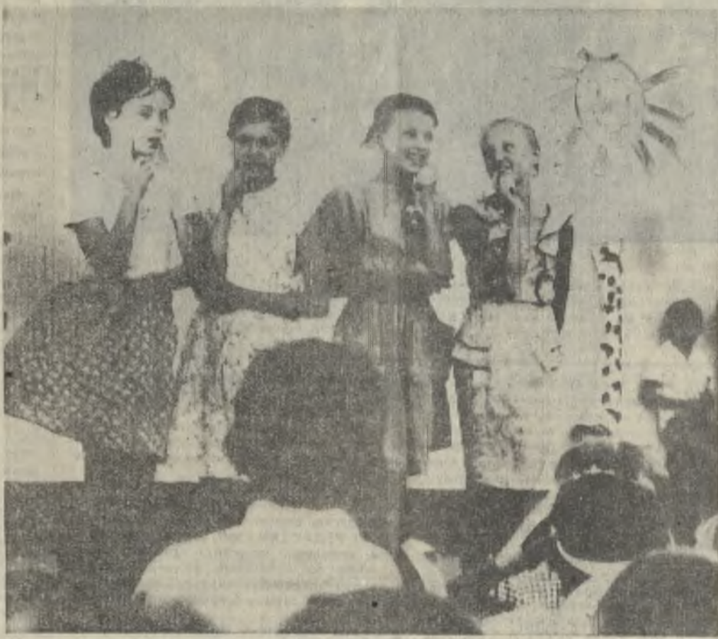
Много выступлений подготовили ребята из детского сектора Дома культуры механического завода. Недавно состоялся концерт на агитплощадке «Искра», в котором ребята приняли самое деятельное участие.

Это определение не случайно. Ведь именно здесь ежегодно происходят многочисленные ЧП. Печальная статистика свидетельствует: только за первый квартал этого года на железных дорогах страны при наездах на автотранспорт произошло немало трагедий. Неудачно начался 1989 год и на Егоршинском отделении дороги: 23 января водитель автомашины «Москвич-412» Пискунов выехал на переезд 143 км станции Коптелово при запрещающих сигналах. В итоге столкновение с проходящим поездом и гибель трех человек.