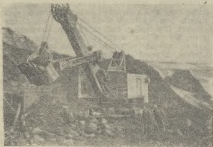
Челябинская область. В конце прошлого года Челябинский совнархоз провел большие организационно-технические мероприятия в угольных разрезах города Коркино.

Два добычных разреза объединены в один, благодаря чему управленческий аппарат сократился на 15 единиц, что дало экономии более 22 000 рублей в месяц. На самих разрезах уменьшилось количество добычных участков за счет их укрупнения. Сократилось количество экскаваторов. Экскаваторы с ковшами емкостью в 1,5 кубометра заменены экскаваторами с емкостью ковшей 4—5 кубических метров. Введена в строй обогатительная фабрика, бытовой комбинат. Эти мероприятия позволили резко повысить добычу угля. Только за январь и февраль коллектив разреза выдал около 35 000 тонн угля дополнительно к заданию. В феврале ежедневно добывалось 1 000 тонн угля сверх плана.