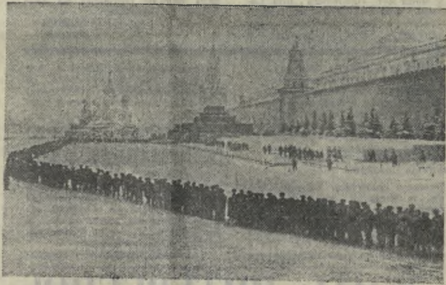
Москва. Красная площадь. К Ленину.

== СЕГОДНЯ — ДЕНЬ ПАМЯТИ В. И. ЛЕНИНА ==