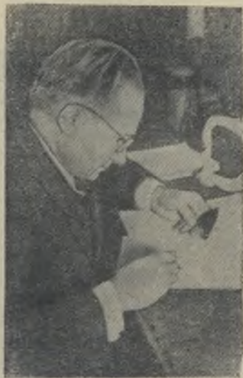
Из дальнего плавания в центральной части Тихого океана во Владивосток вернулся «Витязь» — экспедиционное судно Института океанологии Академии Наук СССР. За 115 дней плавания «Витязь» прошел более 17 тысяч миль. Коллективом научных сотрудников проделана большая исследовательская работа по программе Международного геофизического года.

По инициативе колхозников происходит объединение мелких артелей и в других районах Львовщины.