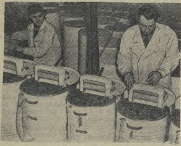
Тамбов. Завод «Революционный труд» Тамбовского совнархоза имеет цех по выпуску стиральных машин. В прошлом году он выпустил 26500 стиральных машин — на 1500 больше плана. В этом году план выпуска стиральных машин значительно увеличивается.