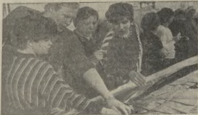
В столичном швейном промышленно-торговом объединении «Москва» впервые в нашей стране внедряется автоматизированная система управления технологиче-

ским процессом подготовительно-раскройного производства. Его внедрение в условиях быстрой сменяемости модели мужских сорочек позволит резко сократить весь производственный цикл от создания конструкторских разработок до получения готового кроя, оперативнее реагировать на запросы торговли. Если сейчас период от поступления заказа из фирменного магазина на партию остроумных сорочек до ее отгрузки с предприятия составляет 2—3 месяца, то новая техника позволит сократить этот срок до 10—15 дней.