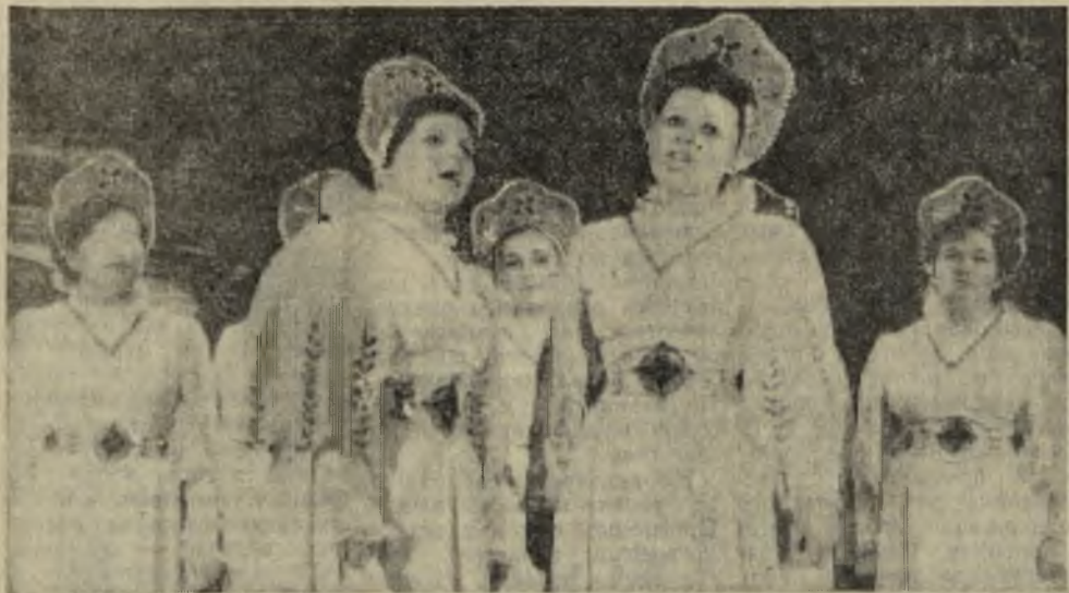
Художественная самодеятельность Глинского Дома культуры радует уже не только односельчан, но и работников полей и ферм всего района. Всегда тепло их принимают в городе.

На снимке: песню о Родине поют самодеятельные артисты из с. Глинское.