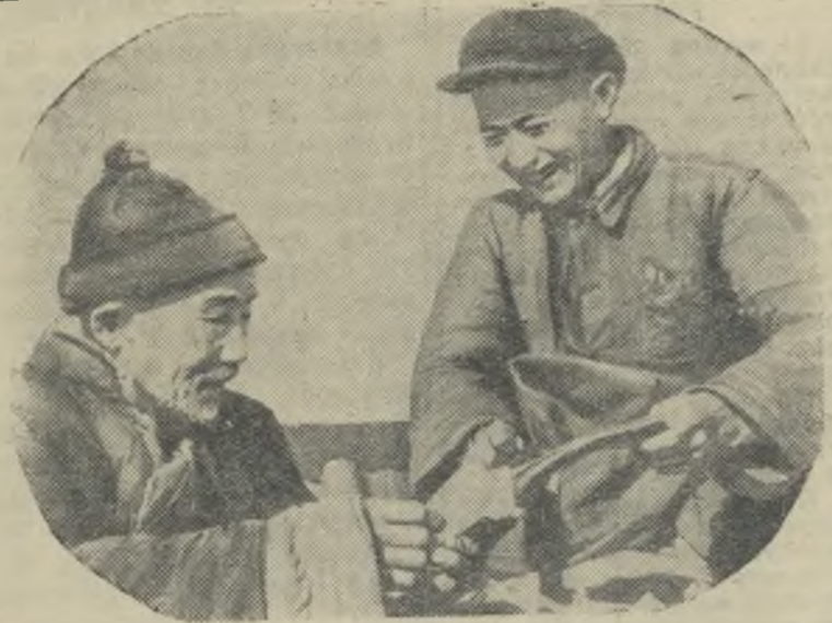
В Китайской деревне повышается жизненный уровень крестьянства. Ярким показателем этого является рост вкладов в кредитных кооперативах и сельских банках. По сведениям народного банка Китая, общая сумма вкладов крестьян в сельских банках и кредитных кооперативах достигает 1.200 миллионов юаней.

Национальный доход увеличился по сравнению с 1956 годом почти на 8 процентов.