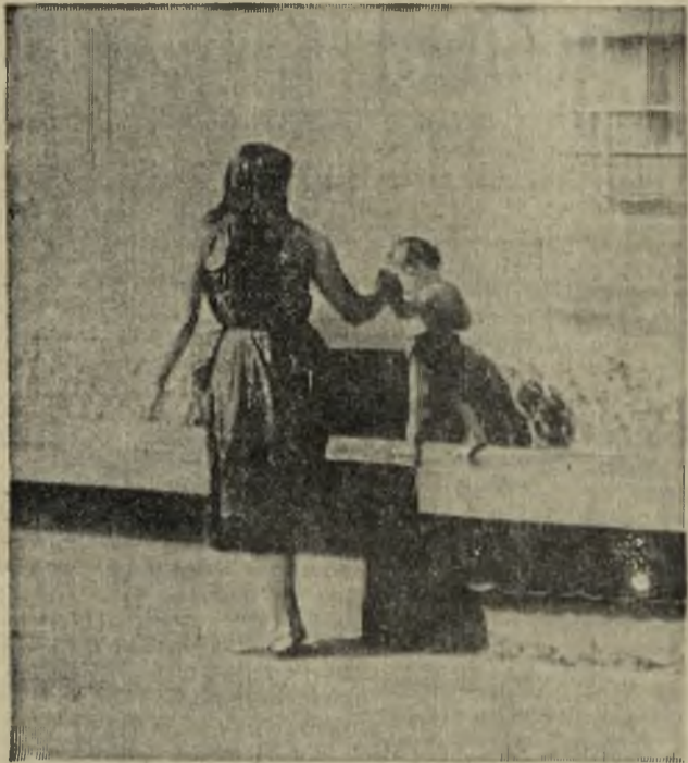
В ВОСКРЕСЕНЬЕ.