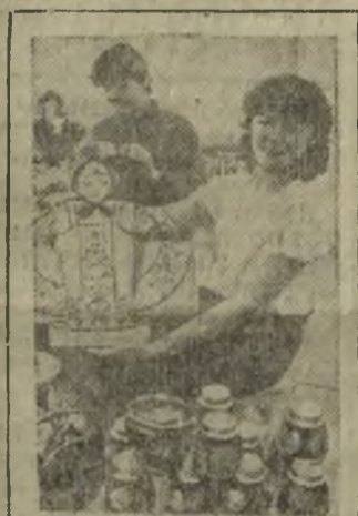
Пермская область. Яркими красками полыхают чайные наборы, квасные кружки, сахарницы, солонки, выпускаемые на участке товаров народного потребления Добрянского домостроительного комбината. В этой радужной палитре угадывается знаменитая хохлома, но формы и рисунки навеяны уральскими мотивами.