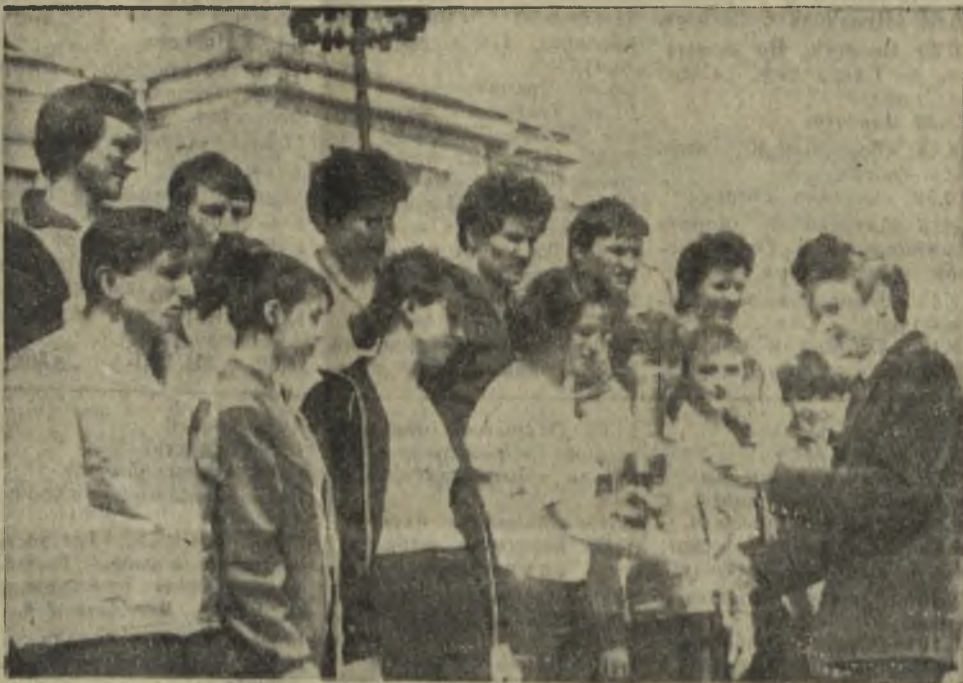
На снимке: кубок вручается команде-победительнице пос. Быстринского.