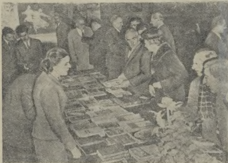
Швейцария. В Женеве открылась выставка «СССР 1957 года». Выставка организована обществом «Швейцария-СССР». На снимке: посетители осматривают книги и журналы, изданные в Советском Союзе на иностранных языках. Фото Фатерлауса. Центральный билд.

Поведение Даллеса, заключает газета, «не нравится нашим союзникам и тревожит многих американцев».