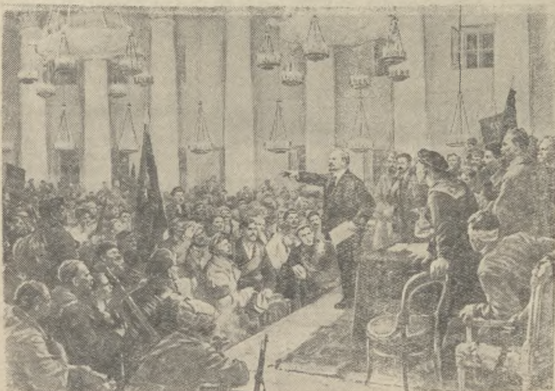
Выступление В. И. Ленина на II-ом Всероссийском съезде Советов.

Репродукция с картины художника В. Серова.