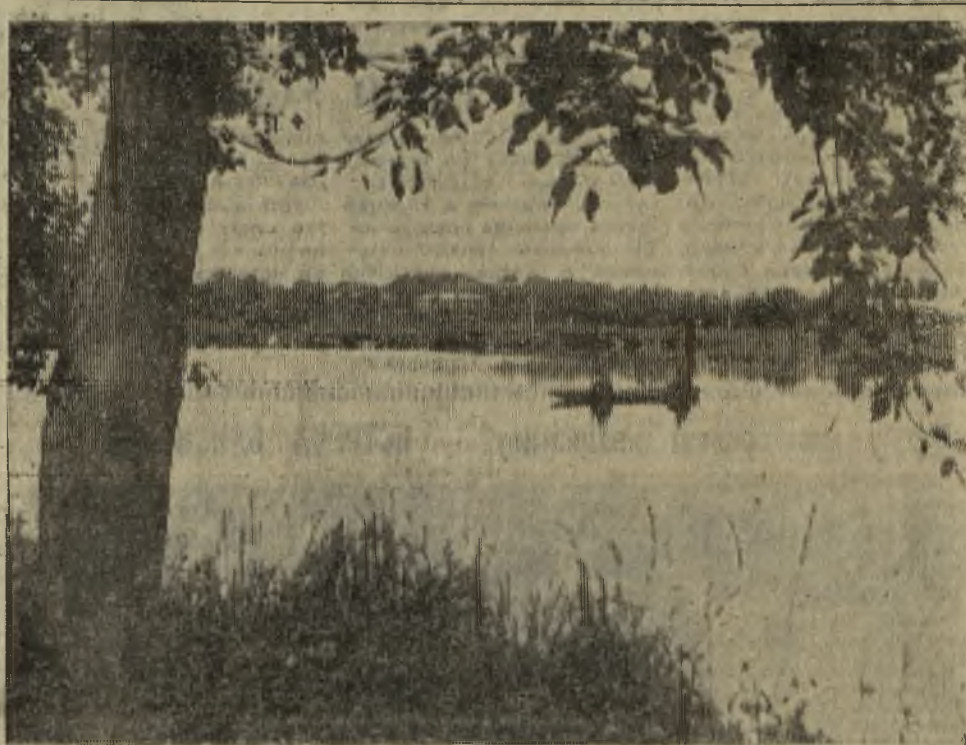
На утренней зорьке.