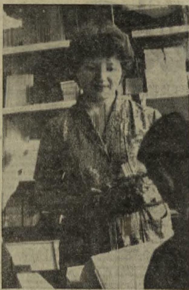
ПРОФЕССИЯ — ГОРДОСТЬ МОЯ СВЕТЛО НА ДУШЕ

Исполком указав на недостатки (низкий удельный вес мелкостручных изделий в общем объеме производства, затягивание замены устаревшего оборудования, отсутствие столовой и стола заказов на молокозаводе), снял с контроля декабрьское решение 1983 года.