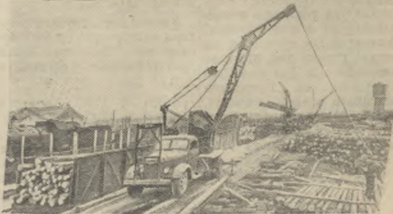
Комп АССР. В предоктябрьском соревновании лесозаготовителей республики вперед идет Усть-Вымский леспромхоз. Он уже почти выполнил годовое задание. На снимке: погрузка древесины в железнодорожные вагоны.

Райком КПСС обязал секретарей партийных организаций по примеру никелевцев пересмотреть ранее принятые обязательства, приняв новые, повышенные, мобилизовать коллективы на их выполнение.