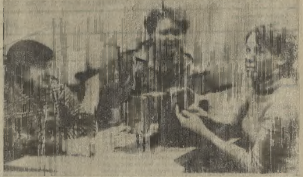
Работницы трикотажного цеха ГорПУ в прошлом году сэкономили пять килограммов пряжи, большое количество швейных ниток. Из сэкономленной пряжи, например, можно изготовить

Из проекта Основных направлений экономического и социального развития СССР.