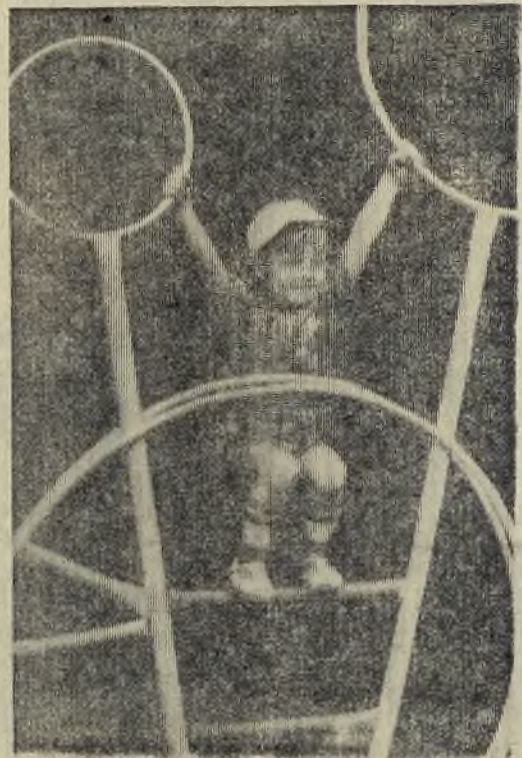
Щедры летние краски! Лучше всех знают это дети.

Улыбки, улыбки, улыбки! Улыбки на лицах людей От чистого сердца Улыбки На лицах московских гостей! Во имя добра и планете, Во имя любви и труда Пусть в мире живут наши дети И светит Кремля им звезда! Звезда эта — символ свободы, Счастливых и радостных дней, Пусть видят ее все пароды, Глаза и сердца матерей «Кошмарной войны не допустим!» — Звучит молодежный призыв. Чтоб не было горя и грусти. Мы проклинали ядерный взрыв. А наш фестиваль — это радость Всех тех, кто во имя добра За мирную борется сладость. За эти улыбки тепла!» А. СЕРКОВ, строитель.