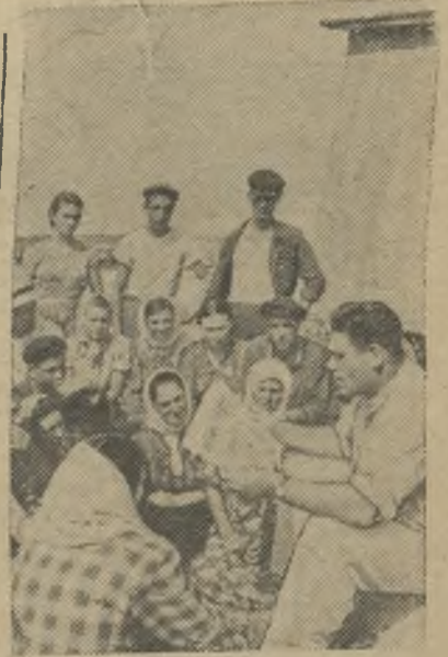
В колхозе „Победа Октября“, Одесского пригородного района.

(Условия разработаны обкомом профсоюза рабочих и служащих сельского хозяйства и заготовок и облсельхозуправлением).