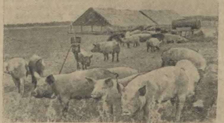
Ставропольский край. Животноводы колхоза „Россия“ Пово-Александровского района широко применяют новейшую технику, позволяющую значительно сократить количество людей, занятых в животноводстве.