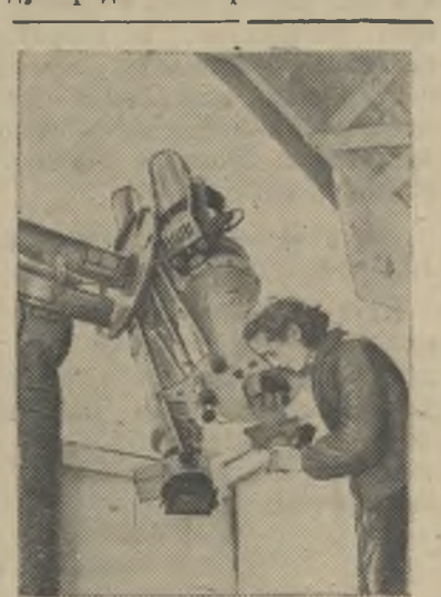
Москва. В процессе наблюдения за фотосферой и хромосферой Солнца по программе Международного геофизического года отделом исследования Солнца Научно-исследовательского института земного магнетизма, ионосферы и распространения радиоволн Министерства связи СССР, расположенного в Московской области, ведется систематическое фотографирование процессов, происходящих на Солнце.

чался 1 июля в 5 часов утра. Активное участие в Международном геофизическом го-