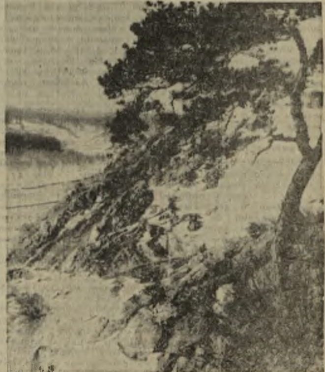
У природы нет плохой погоды...