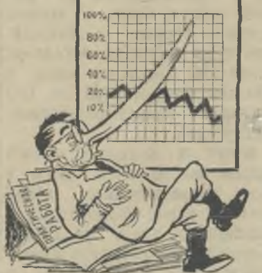
ПЛАН производства мяса по колхозу

От плана нас тянуло ввысь, Кривая печально спускалась ко дну. За колхоз и колхозников мы опасаемся: Они не с мясом, а с носом останутся!