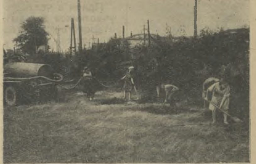
Уход за садами в скверах города.