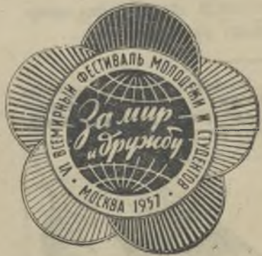
Эмблема VI Всемирного фестиваля молодежи и студентов.