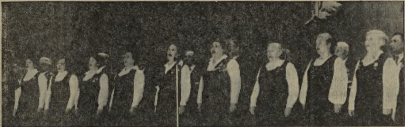
«Красная гвоздика» — так назвали свой хор ветераны войны и труда пос. Быстринский. За плечами каждого война и нелегкая работа в тылу, но когда они поют свои песни, частушки, танцуют старинную «шестеру» — кажется, сбрасывают не один десяток лет. Завтра, в День Победы, они вновь выйдут на сцену — не уходят в запас ветераны!