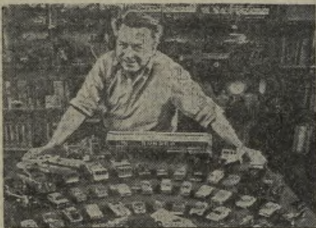
Двести «авто» и дело всей жизни

Основное в подведении итогов этого спортивного праздника—массовость участников каждой организации. Каждый, кто хочет поддержать спортивную честь своего коллектива, кто хочет приятно, с пользой для здоровья, провести выходной день —на лыжи!