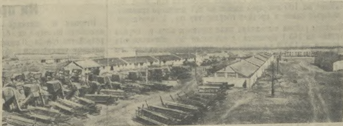
На снимках: слева—тракторный отряд, положивший начало созданию МТС имени Шевченко, перед выходом в поле в 1927 году (снимок 1927 года); справа—общий вид усадьбы МТС имени Шевченко в 1957 году.

С каждым годом улучшаются культурно-бытовые условия жизни механизаторов. Для работников МТС выстроены благоустроенные дома. Жилищное строительство продолжается и в этом году. Здесь имеется клуб с библиотекой, насчитывающей 8 тысяч томов. Библиотеку посещает свыше 300 постоянных читателей.