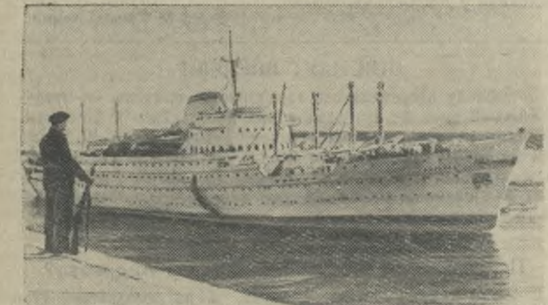
Египет. Судходное движение по Суэцкому каналу полностью восстановлено.

* 12 мая в Лондоне закончила свою работу 9-я конференция Общества англо-советской дружбы. Конференция приняла обращение к английскому народу, в котором подчеркивается, что англо-советская дружба может помочь решению важных вопросов.