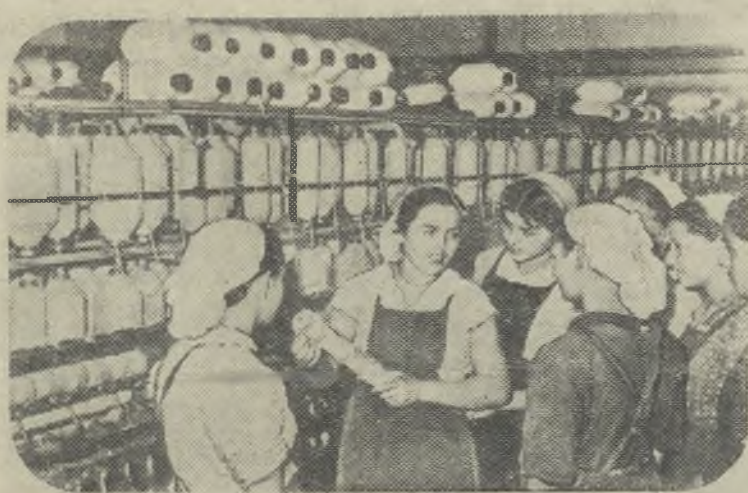
В Народной Республике Албании женщина стала активным строителем социалистического общества. Накануне освобождения страны число занятых на производстве женщин не превышало 700 человек. Теперь на предприятиях, в учреждениях, в школах и больницах трудятся свыше 28 тысяч женщин, 5.800 женщин являются передовиками производства.

Митинг окончен. Под возгласы «ура», «ваньсуй» К. Е. Ворошилов и сопровождающие его лица покидают трибуну. Мощно звучит песня «Москва—Пекин».