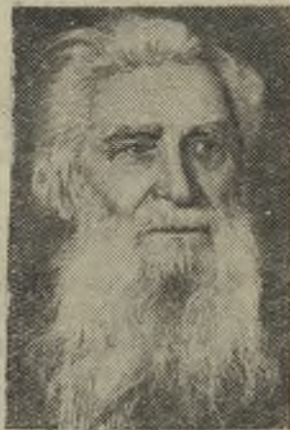
Скульптор С. Т. КОНОНОВ.

Премия присуждена за скульптуру „Автопортрет“.