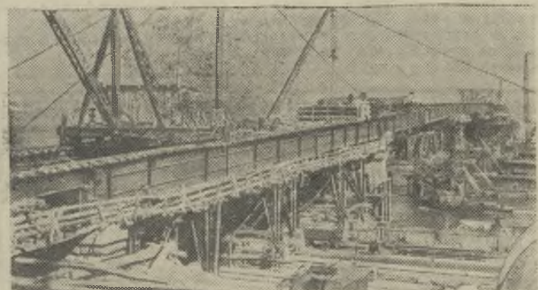
Киев. Развернулось строительство пешеходного моста через Днепр. Он соединит набережную с любимым местом отдыха киевлян — Трухановым островом. На снимке: строительство моста.