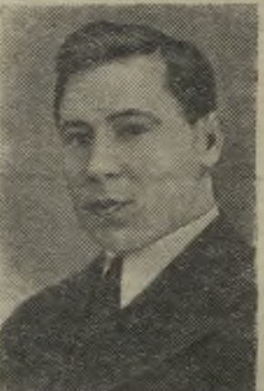
Поэт МУСА ДЖАЛИЛЬ.

Премия присуждена за роман „Русский лес“.