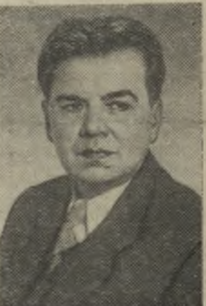
Писатель Л. М. ЛЕОНОВ.

Премия присуждена за роман „Русский лес“.