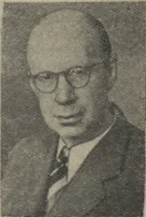
Композитор С. С. ПРОКОФЬЕВ.

Премия присуждена за скульптуру „Автопортрет“.