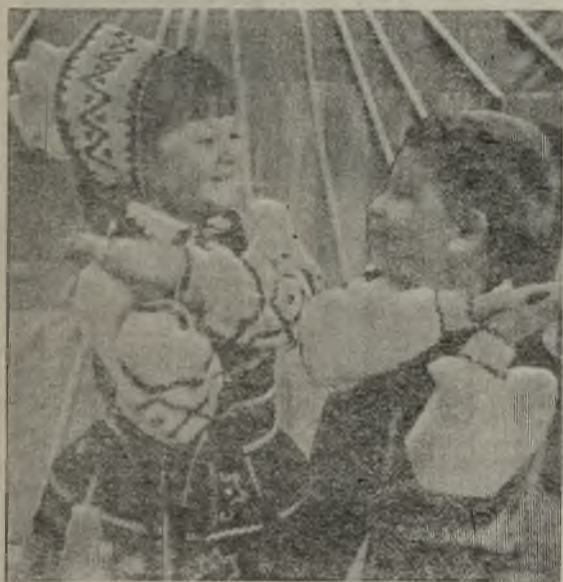
ТАНЦУЮТ ДЕТИ.