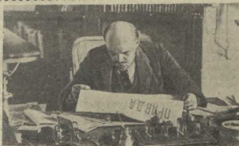
В. И. Ленин в рабочем кабинете в Кремле (1918 г.).