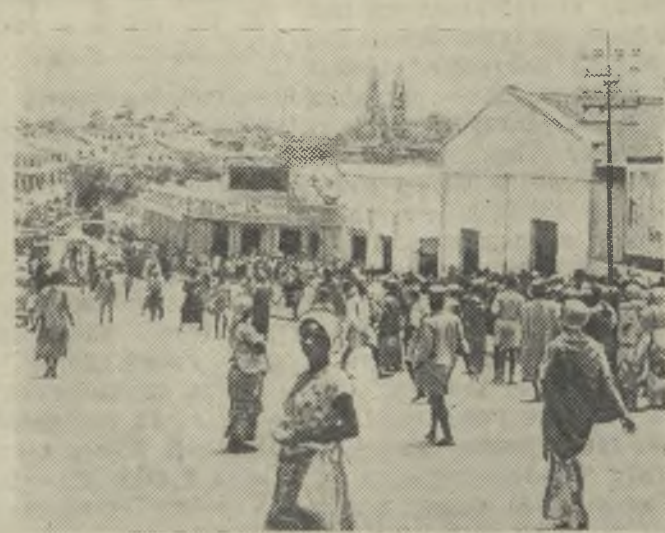
Гана. Центральный рынок в городе Кумаси.

Так жизнь подтверждает вещие слова Ленина, о том, что рано или поздно придет конец империалистическому гнету во всех уголках земного шара.