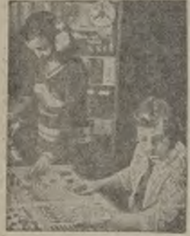
Эстонская ССР. Продюсер Таллинского завода музыкальных кассет всеюсоюзной фирмы грампластинок «Мелодия» хорошо известна многим любителям музыки как в Советском Союзе, так и за рубежом.