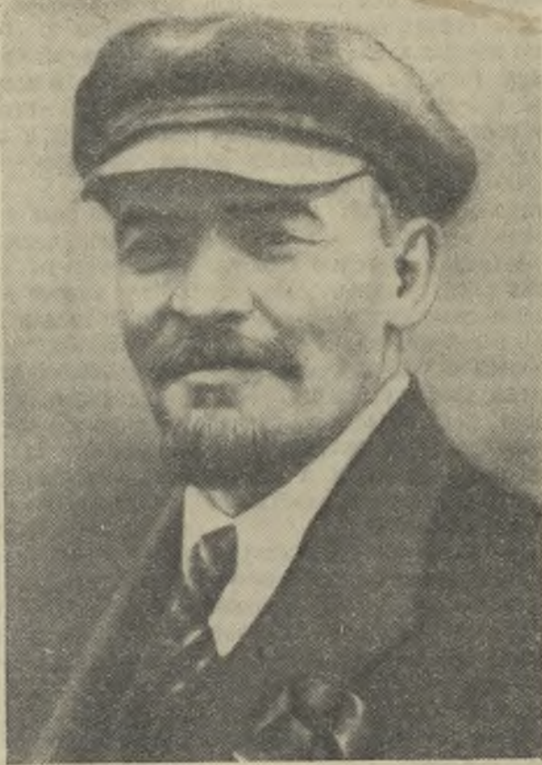
В. И. Ленин. 1920 год.

Это было тревожное время. Опасность подкарауливала