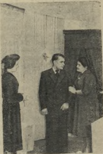
На сцене идет спектакль «Опасное заблуждение».

В здании клуба никелевого завода есть витрина с большим количеством фотокарточек. Здесь и властная Васса Железнова, требующая своих прав на внука («Васса Железнова»), и «городская» Ага Шука («Калиновая рожа»), уписывающая за обе щеки куренка, и матрос Швандя («Любовь Яровая»), и Лукерья («Свадьба с приданным») и много других персонажей.